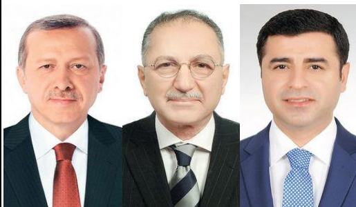
(左からエルドアン首相、イフサオール氏、デミルタシュ HDP 共同党首)