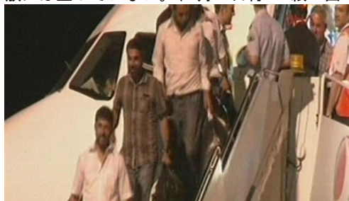
(HD紙インターネット版より)

ISILは、6月11日、モスル市内を占拠後、在モスル・トルコ領事館の49の職員も拉致しており、同事件は未だ解放には至っていない。(7月4日付HD紙1面等)