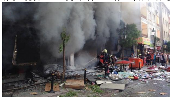
(HD紙インターネット版より)

12日、ゼイティンブルヌ市内の4階建てビルの地下1階の作業場内で爆発が発生し、作業場内にいた3名が死亡、11名が負傷した。爆発原因は調査中だが、ムトゥルー県知事はテロの可能性を否定し、爆発はガス漏れによる可能性があると発表している。(7月13日付HD紙インターネット版)